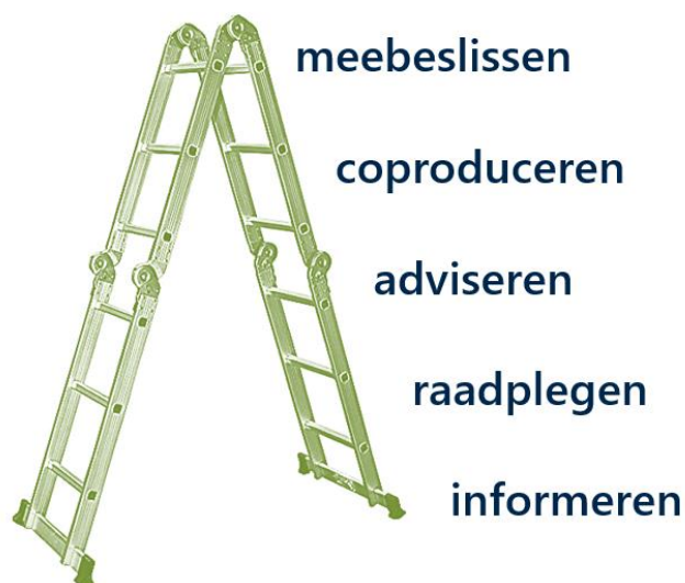
Figuur 1: De participatieladder

Budget- of begrotingsparticipatie staat heel hoog op de participatieladder. Zoals de term zegt, mogen burgers zelf beslissen hoe zij (een deel van de) overheidsmiddelen willen besteden. Afhankelijk van het proces kunnen burgerbegrotingen ondergebracht worden onder coproduceren of meebeslissen/zelfbestuur. In elk geval beslissen burgers mee welke projecten of beleidsdomeinen gefinancierd moeten worden. In sommige gevallen (zoals bij de wijkbudgetten) zitten ook vertegenwoordigers van de overheid mee aan tafel, dus gaat het om coproduceren. Maar in vele gevallen faciliteert de overheid enkel het proces en beslissen de burgers autonoom over het toewijzen van de budgetten.